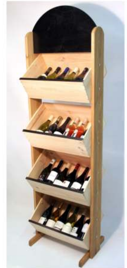
REGAL FÜR WEINKISTEN aus Holz Ref. PC

Struktur aus massivem Eichenholz. Kisten aus Kiefernholz.