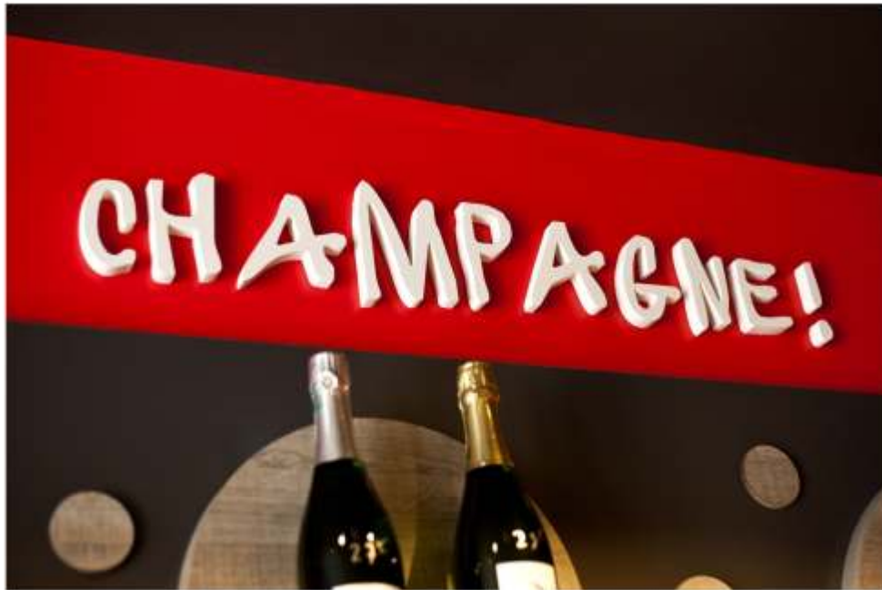
SCHRIFTZÜGE IN 3D

Personalisieren Sie Ihr Geschäft durch unsere Schriftzüge in 3D ! Schriftzüge in weiss, Durchmesser 19 mm, variable Grösse.